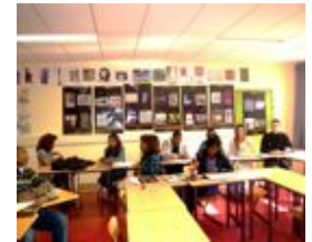
Atelier Acad. de Créteil

MIXART est un projet interactif qui propose aux élèves de la 4 ème à la Terminale de partir à la rencontre des artistes de street art et de leurs techniques de travail. Chaque établissement (ou chaque classe ?) participant recevra la visite d'un artiste de street art qui viendra faire partager son expérience et sa passion au cours de deux modules de deux heures. Au cours de ces quatre heures d'Ateliers-Rencontres en classe avec les professeurs, les élèves pourront se familiariser avec les techniques du lettrage, du papier collé et de la bombe aérosol. Les artistes les conseilleront également pendant la réalisation de leur dessin en vue du concours MIX-ART tout en réfléchissant avec eux aux notions de diversité culturelle, de partage et d'échange.