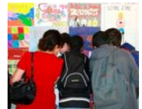
Exposition de dessins, Paris

Les jeunes participants devront réaliser individuellement ou en groupe une oeuvre sur le thème de la diversité culturelle. Afin de les impliquer pleinement dans l'opération, les élèves sélectionneront eux-mêmes les 4 meilleures productions de leur classe à présenter au jury final. Toutes ces productions seront par la suite présentées à un Jury formé d'artistes, de membres du Rectorat et de professeurs qui désigneront les lauréats des Trophées Mix-Art de la diversité.