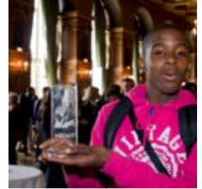
Jeune Lauréat 2009/2010

Au cours de cette cérémonie, le public pourra découvrir les œuvres originales des participants. Un recueil compilant les meilleurs dessins des élèves sera remis aux personnes invitées. La cérémonie de remise des trophées se poursuivra avec une performance de street art en fusion avec un concert de musique classique.