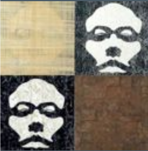
Figure féminine de l'art urbain, YZ se fait connaître en 2003 par son projet « Open your eyes » qu'elle développera à l'international.

Plus tard, avec une même approche minimaliste, YZ s'intéresse à d'autres visages qu'elle réalise sur des affiches en papier kraft. Elle tente de situer la place des êtres dans notre société, décrit et décrypte nos modes de vie à travers l'image mise en scène des habitants des villes qu'elle traverse.